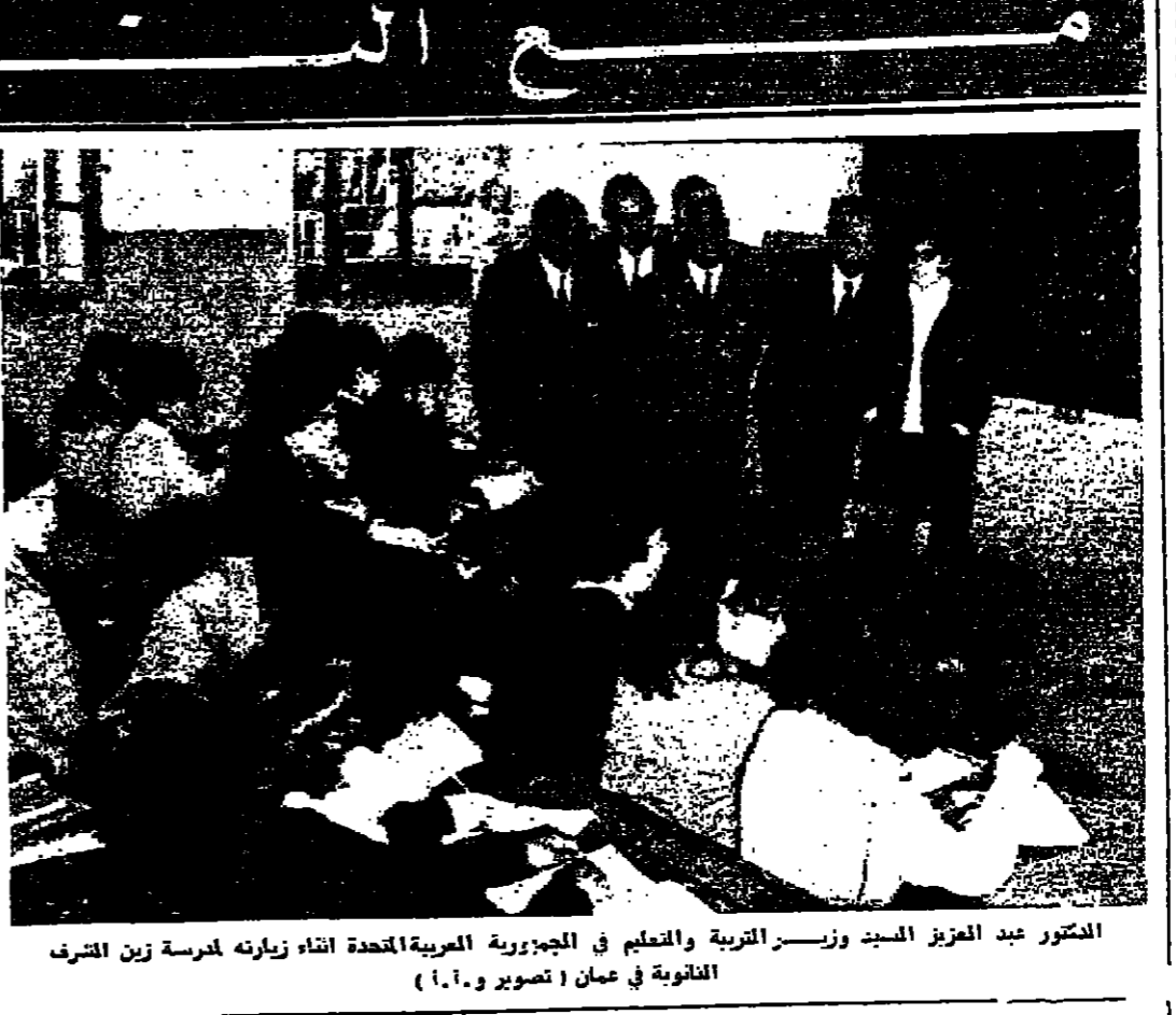
المختار عبد العزيز السيد وزير التربية والتعليم في الجمهورية العربية المتحدة اثناء زيارته مدرسة زين الشرف الثانوية في عمان